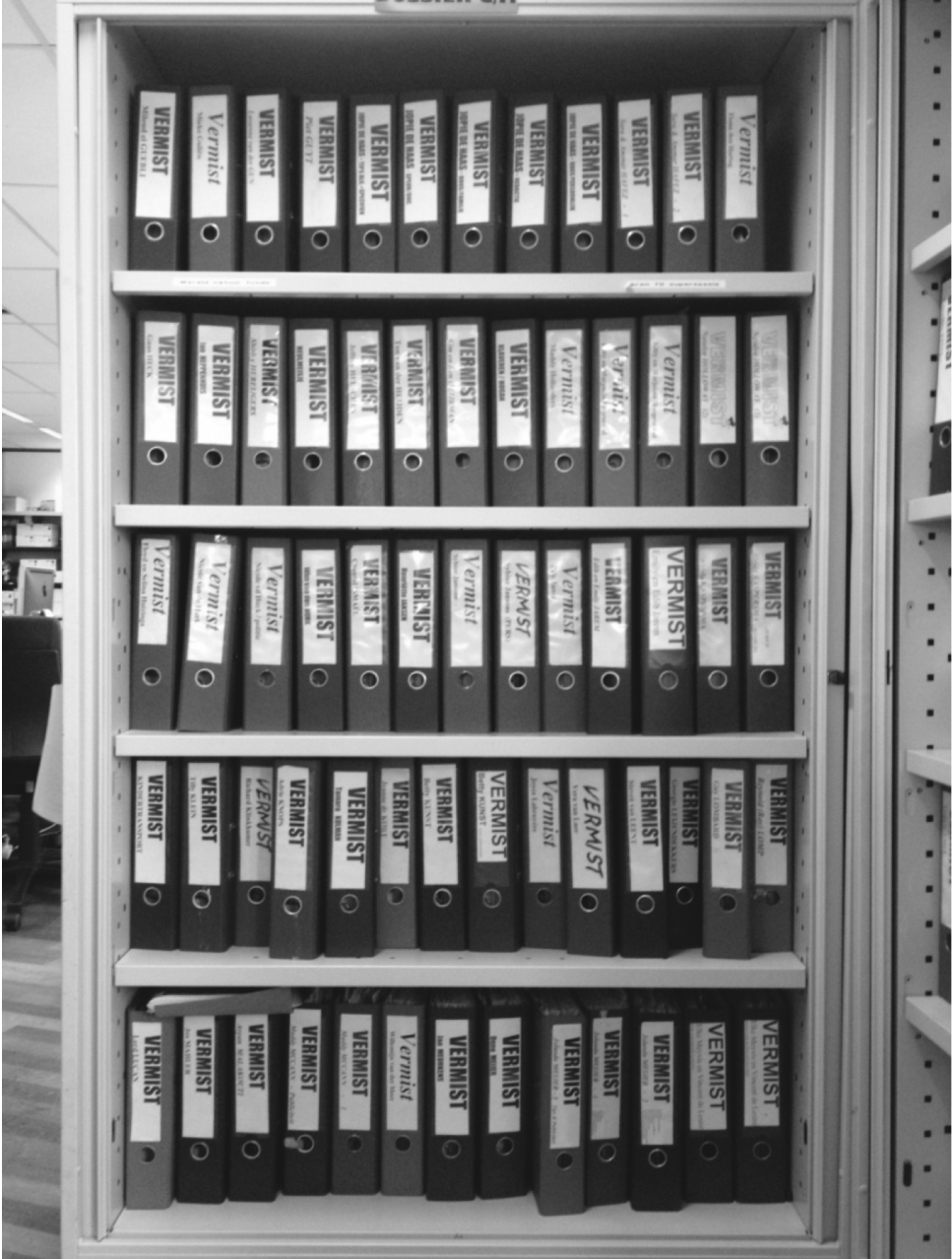
Dossierkast in de redactiekamer van AVROTROS VERMIST