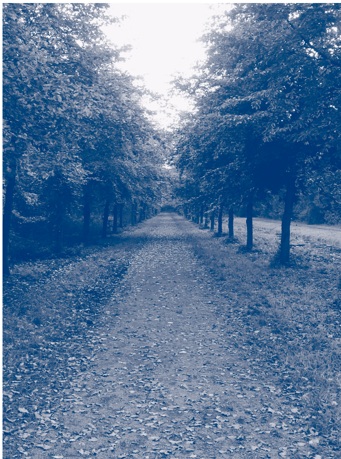
Bosperceel waar een slachtoffer is gevonden

heeft. Uit de politiedossiers en de interviews is af te leiden dat deze vraag voor in elk geval vier zaken bevestigend beantwoord kan worden. Een van de slachtoffers ligt begraven nabij een vakantielocatie waar zij en de dader samen zijn geweest. Een andere vermiste vrouw wordt gevonden in een bos waar zowel zij als de dader met regelmaat kwamen. Een ander slachtoffer ligt begraven op de vaste route waar zij en de dader weleens gingen wandelen en waar het slachtoffer met haar zus hardliep. En ten slotte wordt een vermiste man gevonden nabij een plas water waar hij en de dader af en toe gingen zwemmen. Voor de overige zaken is op basis van het dossier niet bekend of de vindplaats een bijzondere betekenis voor de vermiste en/of de dader heeft.